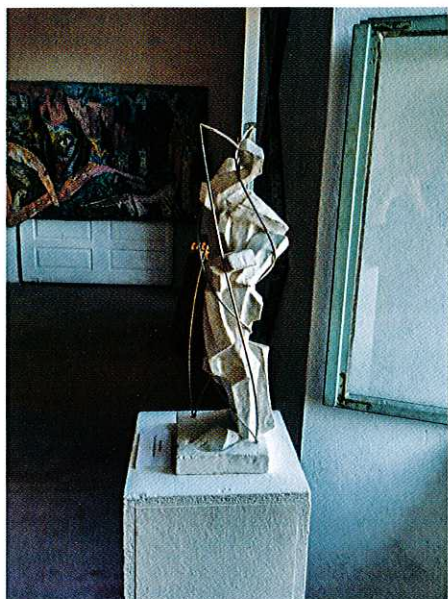
Marjan Drev: Figura v vozelnem prostoru

Ko boste tako naslednjič na cesti srečali staro ženičko ali pa osamljenega gospoda, se ne posmehujte in jih ne pomilujte, saj ne vemo, za-